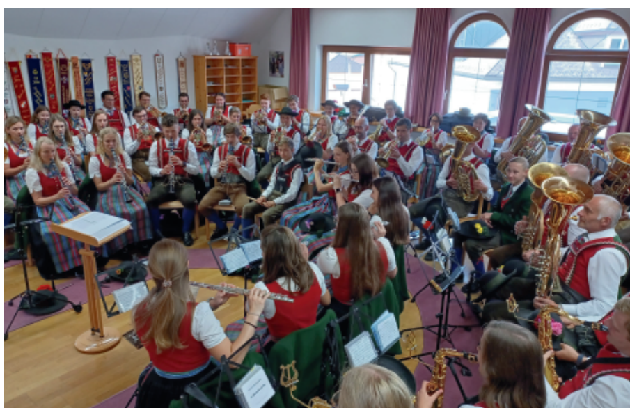
Wir platzen aus allen Nähten!

sikverein und das Land Salzburg überhaupt gestemmt werden kann, dürfen wir euch erfreulicherweise mitteilen, dass die Bauarbeiten Anfang September begonnen haben. Geplant ist eine Erweiterung um 140 m 3 damit jeder künftig wieder genug Platz zum Musizieren hat. Damit jedoch diese finanzielle Hürde seitens des Musikvereines bewältigt werden kann, sind wir auf eure Unterstützung angewiesen. Unsere jährliche Musikbeitragsammlung fällt heuer aus, stattdessen wird für unser neues Heim gesammelt. Wir werden in nächster Zeit durch die Dörfer ziehen. Die TMK bedankt sich jetzt schon im Voraus herzlich für eure Spenden und möchte sich auch im Zuge dessen mit einer Adventwanderung am Donnerstag, den 8. Dezember 2022 erkenntlich zeigen. Nähere Infos folgen!